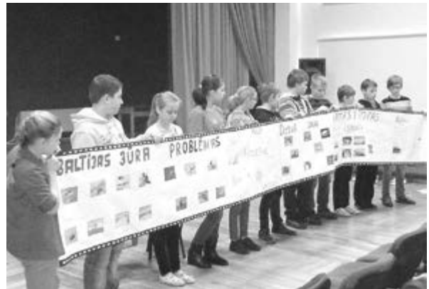
6.klase prezentē savu projektu par Baltijas jūru.

Uz MMU nodarbībām devās Straupes pamatskolas un Stalbes vidusskolas skolēni kopā ar savām matemātikas