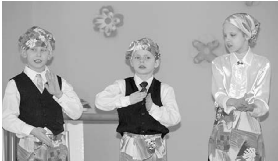
2.a klase rāda kā top maize.

9.a klase: mūsu projekts „Dzīvnieku patversme Cēsis” deva iespēju iepazīt kas tur dzīvo un strādā. Uzzinājām kādi dzīvies ceļa līkloči piemēklējuši tur dzīvojošos suņus un kaķus. /Laura Dūdelne/