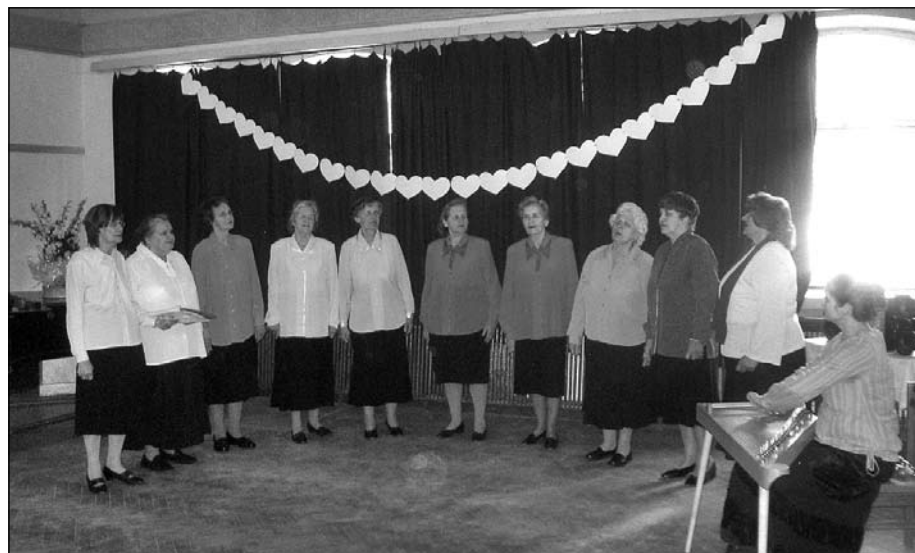
“Dzīvotprieka” meitenes uz Līgatnes tautas nama skatuves.

Patīkama tāda dziesmota satikšanās. Noteikti atkal brauksim, ja tikai kaut kur mūs aicinās.