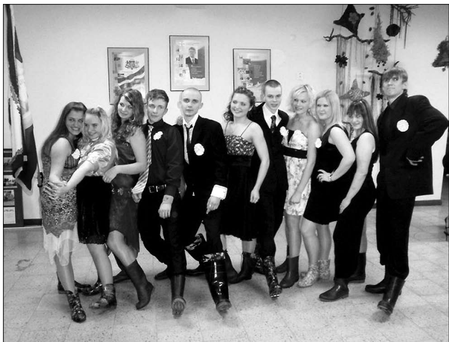
Divpadsmitklasnieki pēc skolas piederības zīmes – žetongredzēna – saņemšanas.

Tagad atlicis saņemties pēdējam mācību cēlienam, lai godam sagaidītu izlaidumu. Darāmā ir daudz, taču, ja būs apņēmība un gribasspēks, tad nekas nav nesasniedzams.