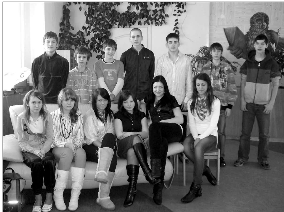
Dzejas konkursa dalībnieki pulcējušies Stalbes vidusskolā.